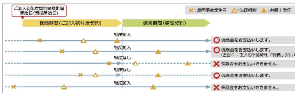
[[「離婚調停に関するトラブル」および「人格権侵害に関するトラブル」の場合の保険責任の開始(イメージ図)]]